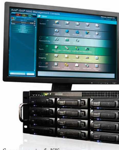
Система семейства ISIS

Ответственность за создание и вещание широкого спектра телепередач YLE, включая сериалы, документальные филь-